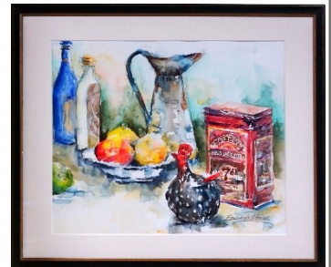
お気に入りの珈琲缶 石川 恵津子