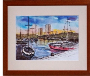
ヨットハーバー 梶本 和男