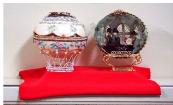
エッグアート 高堂 佳代子