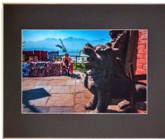
ネパールの思い出 大橋 廣史