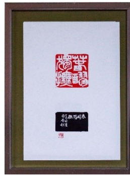
春醪獨撫 陶淵明の詩より 坂本 喜多子（舜華）